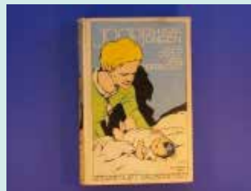
▲アンネが隠れ家で読んでいたのと同じ本