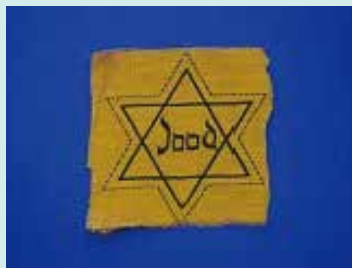
▲ダビデの星 (オランダ語)