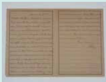
▲収容所解放時オットーさんが 母親にあてた手紙 (複製品)