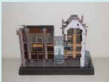
▲アンネの隠れ家模型 (アンネ・フランク・ハウス制作)